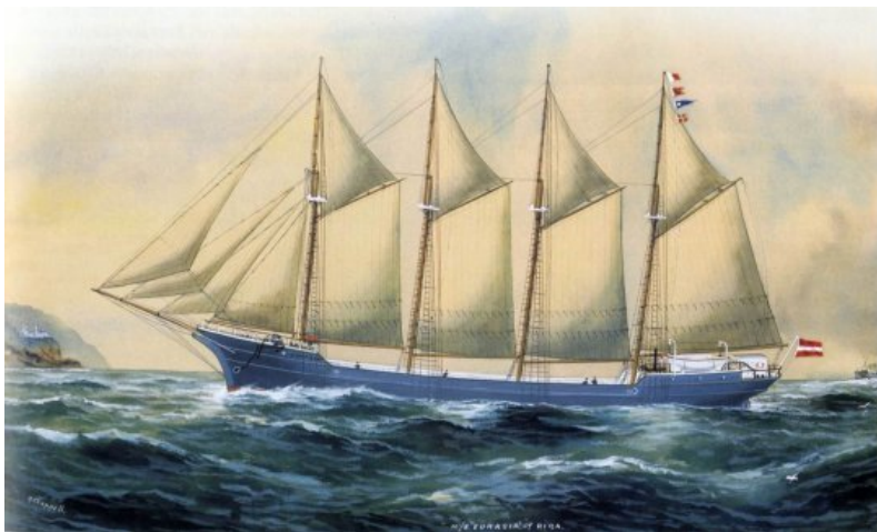
Четырёхмачтовая гафель-шхуна. Таким же был построенный в Вентспилсе Абрахам . Гафель-шхуны были типичными, так называемыми крестьянскими судами.