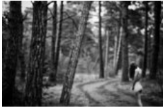
"Jūras vērtos" atklās Agra Klestrova fotoizstādi 👍 0