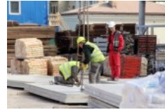
Ekonomiski aktīvo iedzīvotāju skaits Latvijā 18 gadu laikā sarucis par 16,8% 👍 0