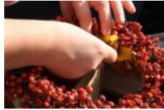
Daba interjerā 👍 0