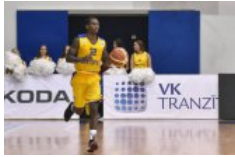
"Ventspils" vēl uz mēnesi pagarina pārbaudes laiku amerikāņim Pitsam 👍 0